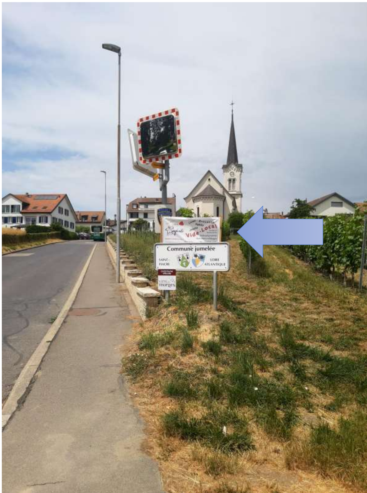
Echichens / Rte de Maladaz (sous l'église, vers le panneau du jumelage)